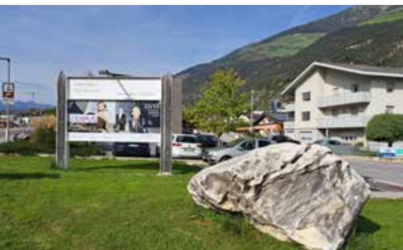
Nun auf Gemeindegrund: die Werbetafel an der Dorfeinfahrt Ost