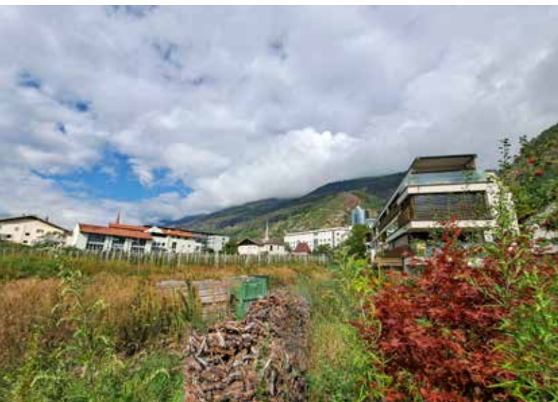
Sorgte für einige Polemik im Gemeinderat: die Ausweisung der Mischzone links des Parkplatzes des Sanitätsbetriebes. Der Wohnturm wird sechs Stockwerke umfassen, also ca. 18 m hoch