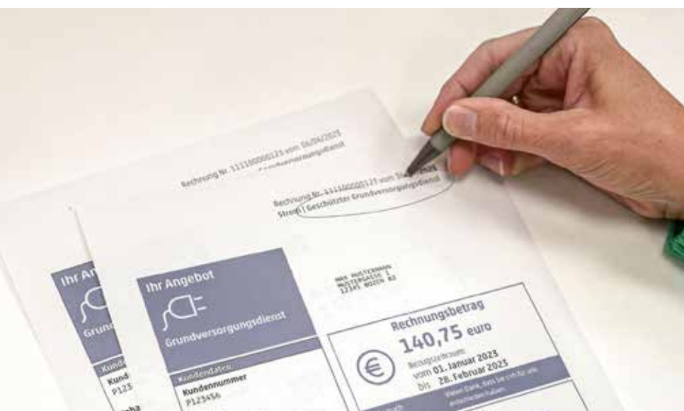
Viele Südtirolerinnen und Südtiroler sind beunruhigt und wissen nicht genau, was das bedeutet.