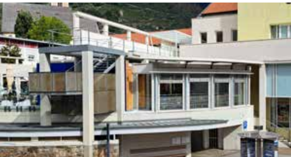
Caffè "Am Platzl": riparati i danni dell'acqua