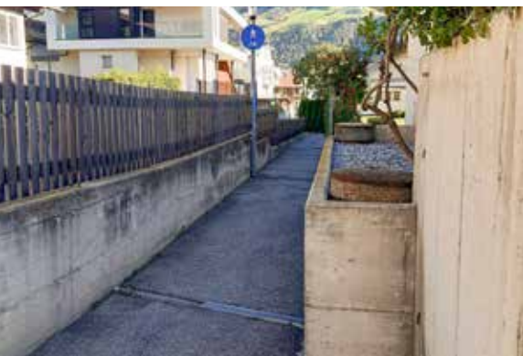
Der Durchgang zwischen Gröblstraße und Kapuzinerstraße wurde nun rechtlich abgesichert

Einige Mitarbeiter der Gemeinde Schlanders haben im laufenden Jahr 2023 ein Dienstjubiläum; ein Mitarbeiter ging zudem mit Ende 2022 in den Ruhestand. Die diesbezüglichen Ehrungen erfolgten im Rahmen des traditionellen „Schöpsernen“-Essens im Schnalstal.