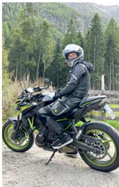
Eine Leidenschaft: das Motorradfahren