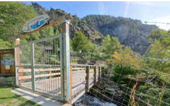
Die neue Brücke für den Schlanderser Fischerverein