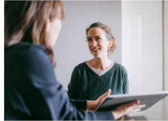
Der geschützten Stromversorgungsdienst wird derzeit in Südtirol von diversen Marken, wie z.B. TU.GG, verwaltet.

Um die Unsicherheit eines von Amts wegen "zugewiesenen" Anbieters zu vermeiden, besteht die einzige Lösung darin, rechtzeitig einen vertrauenswürdigen Lieferanten auf dem freien Markt zu wählen. Der Zeitrahmen ist jedoch eng gesteckt: Die Versteigerung wird bis Ende 2023 ausgeschrieben und vergeben.